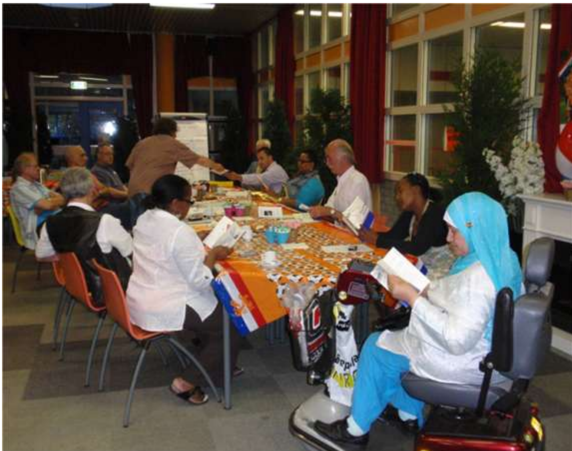
Feijenoord vertelt: initiatiefgroep Culturen werken samen

Het Feijenoord-verhaal bleek van meerdere kanten aanknopingspunten te geven. Vooral de kinderen uit de verschillende culturen spelen samen en maken op jonge leeftijd het onderscheid niet. Met het ouder worden komt de scheiding. In het speeltuinwerk wordt veel geleerd over de interculturele samenwerking. Men wil deze expertise beschikbaar stellen voor onder andere de Marokkaanse en Nederlandse groepen.