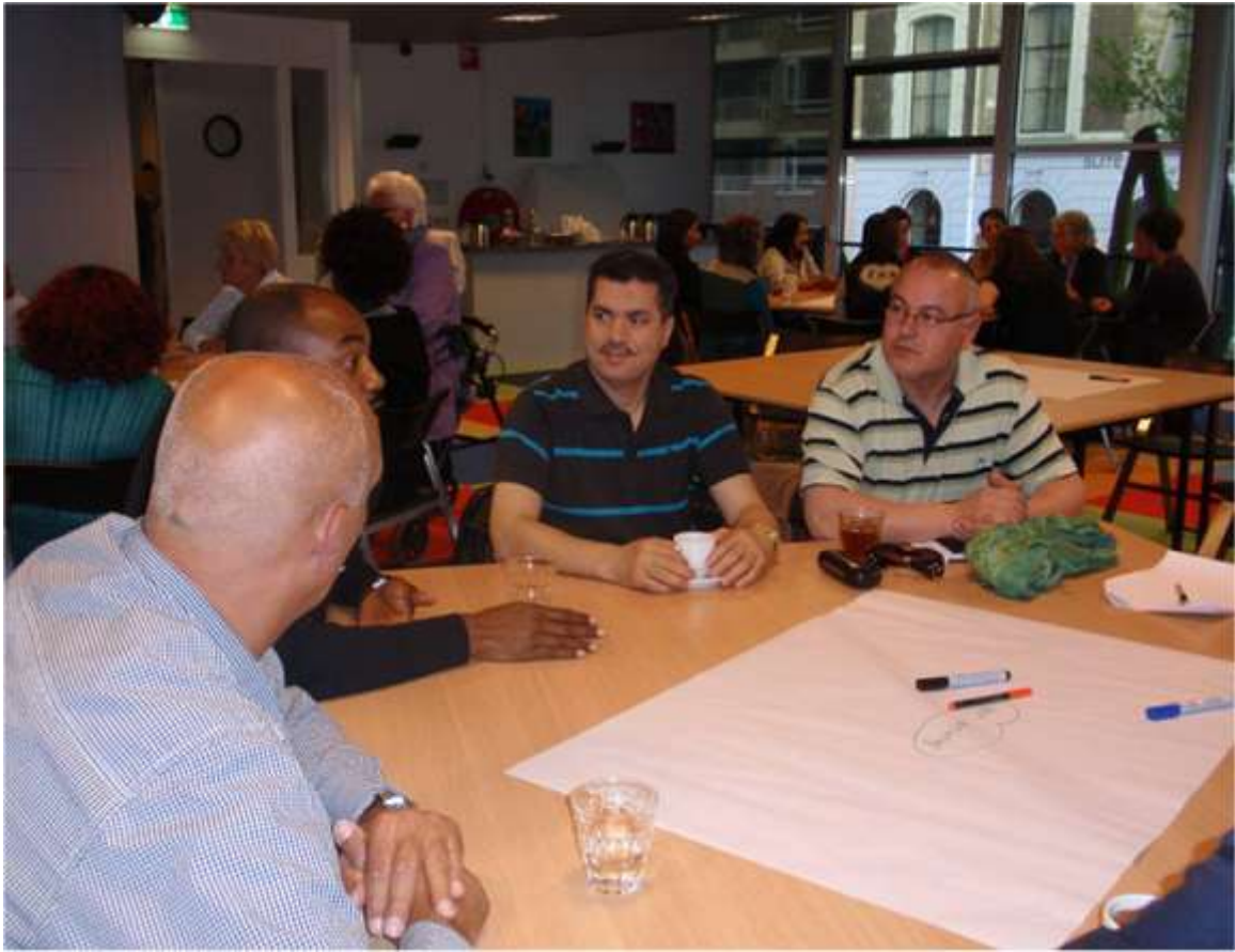
Feijenoord vertelt: bewoners en professionals bouwen microstructuren